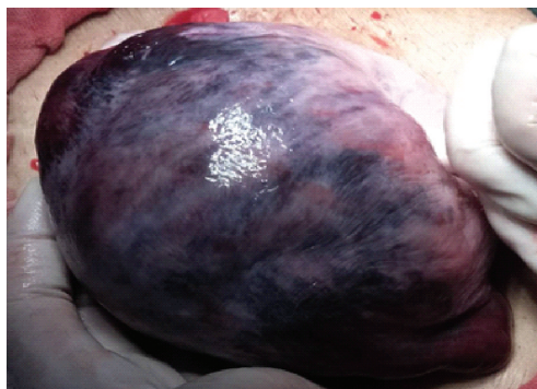
图 2 子宫胎盘卒中术中大体图,重度胎盘早剥子宫表面呈紫蓝色瘀斑